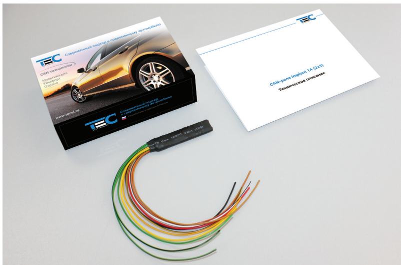
Рис. 2. Комплект поставки